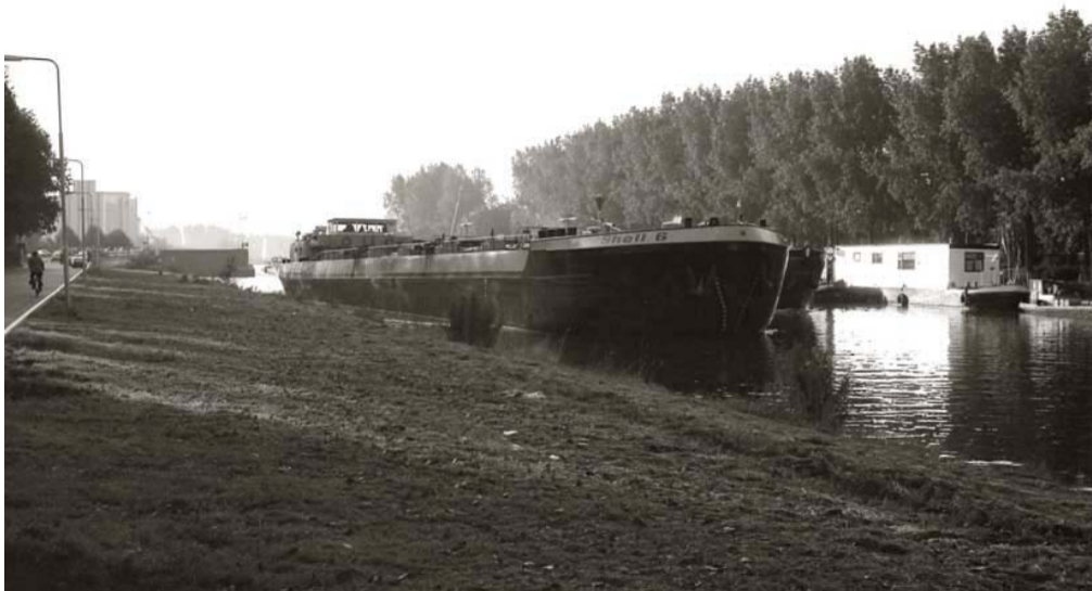
Shell 6 in Groningen.