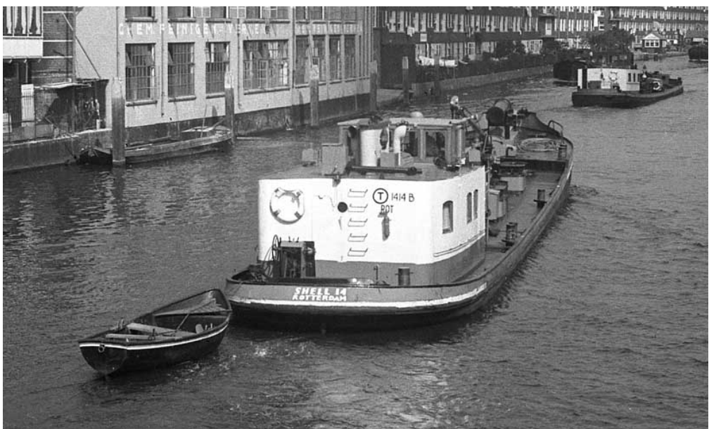
Shell 14 in Rotterdam.