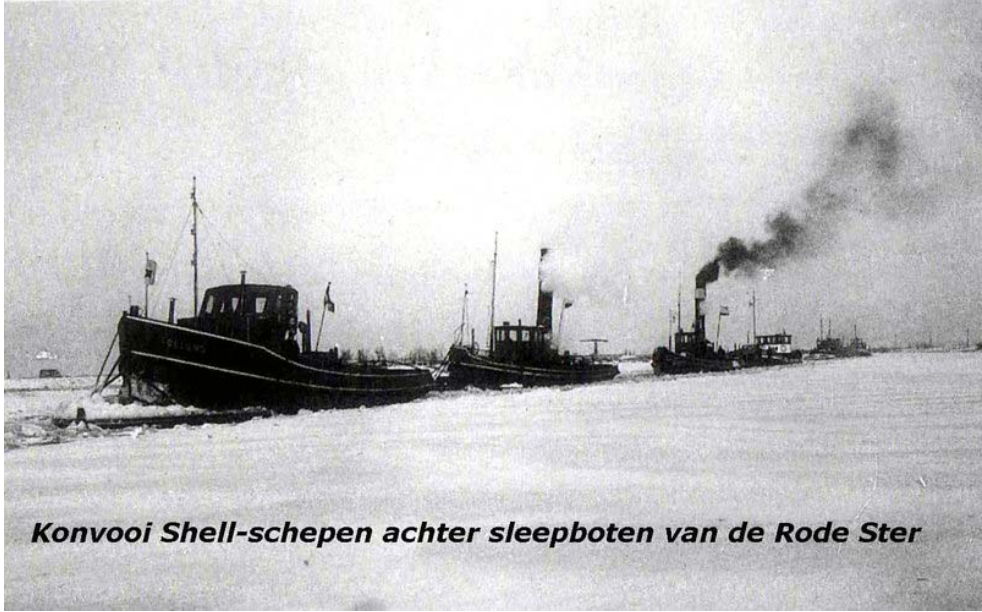
Konvooi Shell-schepen achter sleeptboten van de Rode Ster