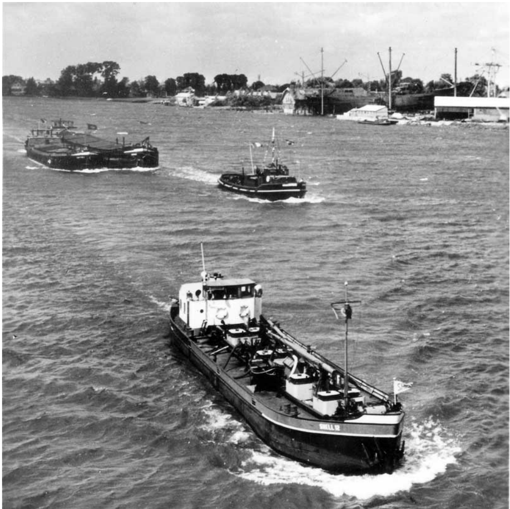
Shell 12 in de Noord.