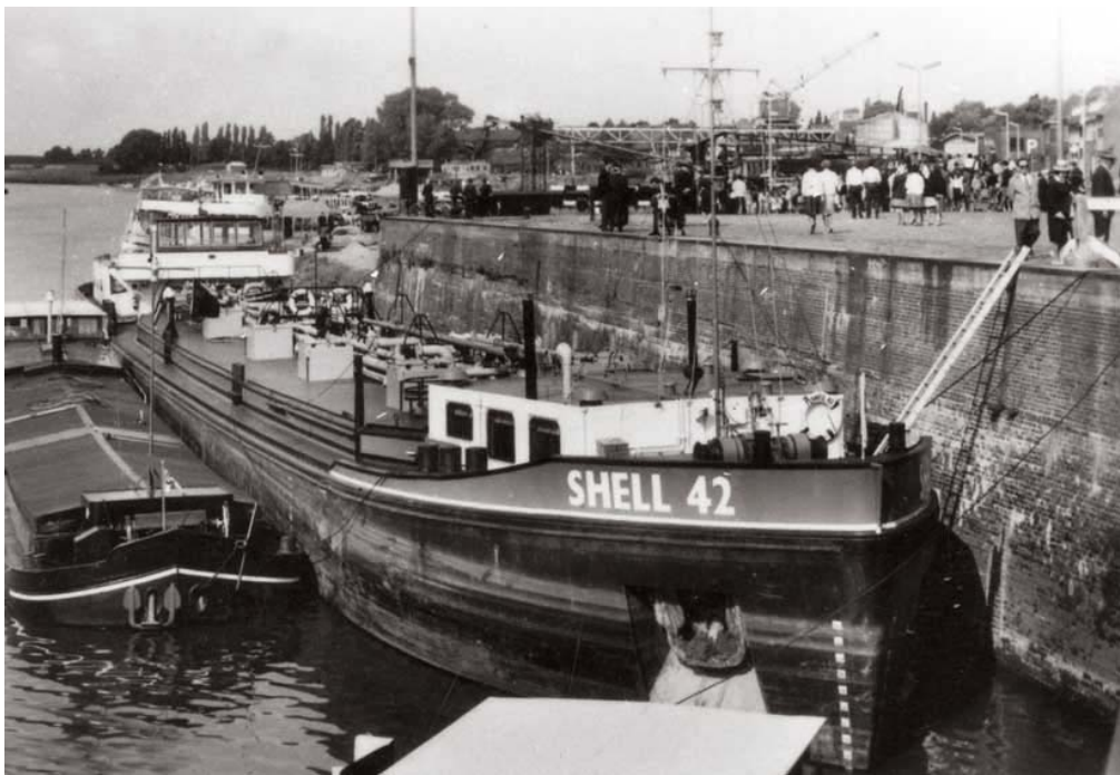
Shell 42 in Venlo.