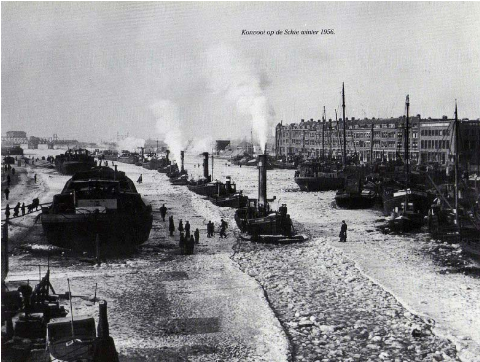
Konvooi op de Schie winter 1956.