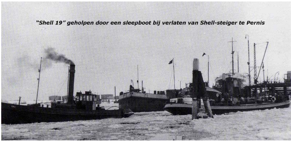
"Shell 19" geholpen door een sleeptboot bij verlaten van Shell-steiger te Pernis